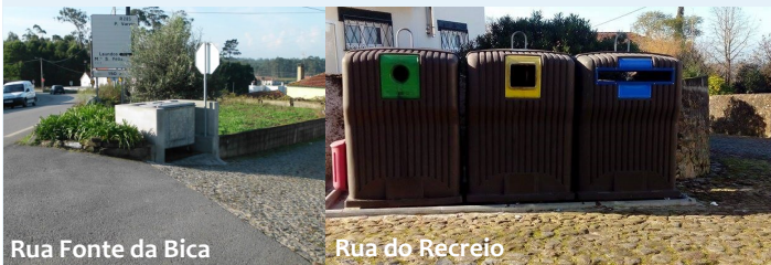
Rua Fonte da Bica

Destaca-se a construção da base para a colocação de um contentor na Rua Fonte da Bica e para o ecoponto situado na Rua do Recreio. Foram substituídos tubos em cimento e caixas junto à ciclovia e na Rua do Fontanário fez-se a reposição do piso, com a substituição dos tubos em cimento. Como é habitual, também procedeu-se à limpeza de todas as ruas e fontes da freguesia.