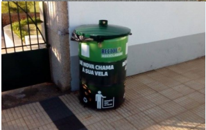
Rua do Recreio

No cemitério colocou-se um ecoponto de reciclagem para cera. Apelamos a toda a população para que coloquem as velas neste ecoponto.