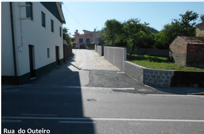
Rua do Outeiro

Mais concretamente foi realizado o alargamento da Rua do Outeiro com correção do pavimento, construção do muro de vedação em troca da cedência de terreno, aumento da grelha de pavimento existente para escoamento das águas pluviais e adaptação do passeio na Rua 10 de Dezembro.