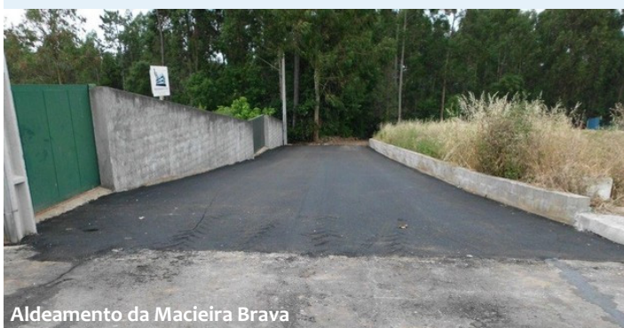
Aldeamento da Macieira Brava

Também na Rua dos Fagueiros foi realizada a reabilitação do pavimento que estava muito degradado e colocou-se betuminoso nas sub larguras das seguintes ruas: Aldeamento da Macieira Brava, Rua N.ª Sra. da Conceição e na Rua da Pateira.