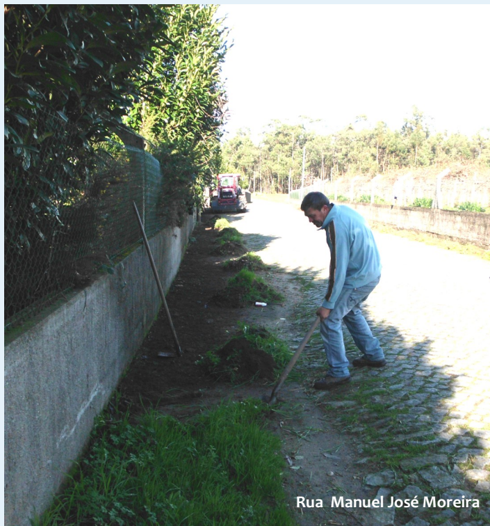
Rua Manuel José Moreira

Para além destas atividades, a Junta de Freguesia continua a fazer a manutenção e conservação de todos os espaços verdes, bem como a limpeza das bermas e valetas das ruas da Freguesia.