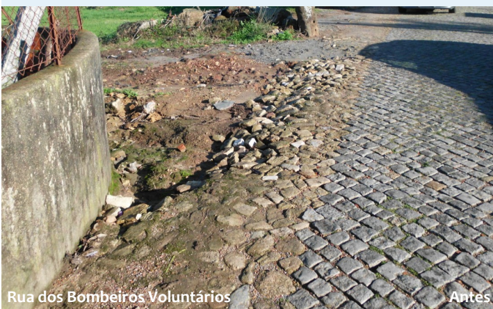
Rua dos Bombeiros Voluntários

Colocaram-se também tubos e sarjetas na Rua Manuel Martins Gonçalves e na Rua Pé do Monte. Nas entradas dos terrenos na Rua de Rapijães colocaram-se tubos para a drenagem das águas e tout-venant.