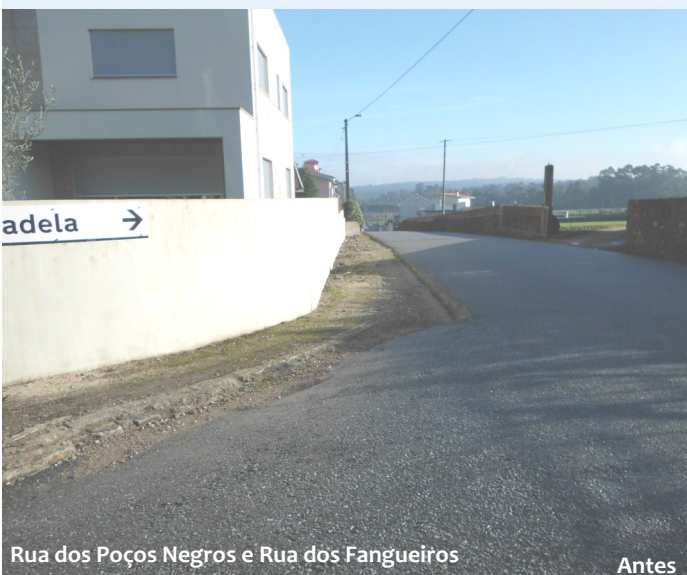
Rua dos Poços Negros e Rua dos Fagueiros