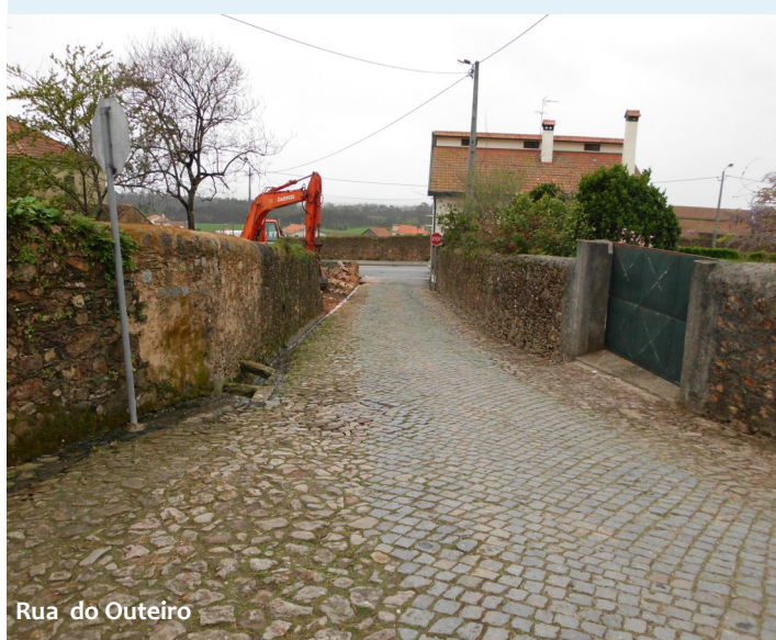
Rua do Outeiro

Procedeu-se à pavimentação da sublargura na Rua dos Poços Negros e na Rua dos Fangueiros. A Rua de S. Félix sofreu reparações e a calçada à portuguesa da Rua das Barreiras foi substituída por cubos. Neste momento, encontra-se em curso as obras de alargamento da Rua Monsenhor Pires Quesado e da Rua do Outeiro.