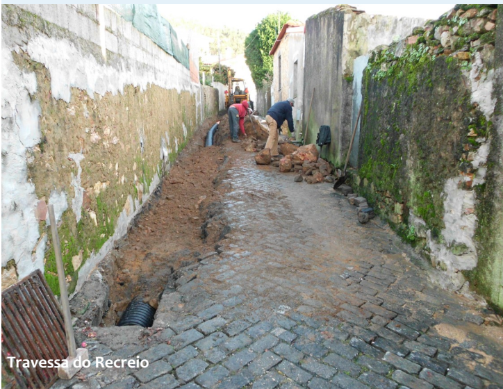
Travessa do Recreio

Na Rua dos Bombeiros Voluntários procedeu-se ao levantamento e reposição do pavimento para colocação de tubos de drenagem de águas pluviais. O mesmo aconteceu na Travessa do Recreio e na Rua dos Caseiros que, para além dos tubos, também foram colocadas sarjetas. Nesta linha de trabalhos, a Rua dos Moleiros também sofreu melhorias significativas com a colocação de uma meia cana.