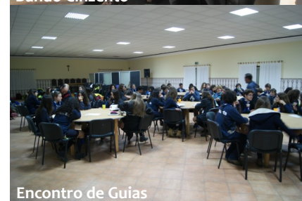
Encontro de Guias

Tendo em conta o lema do acampamento “Carpe Diem”, cada tribo foi formada tendo por base poetas portugueses.